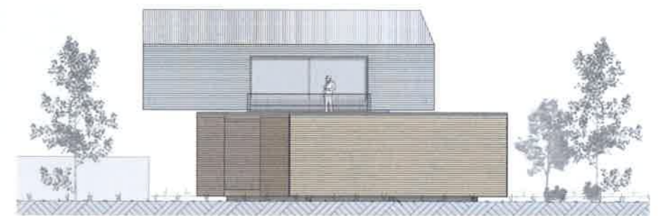
Fassadenansicht Süd: Die Gebäudehöhe bis zum Firstblech liegt bei 8,68 Metern.

Weber und Bärtschi sind auch Geschäftspartner. Die gesamten Holzbauarbeiten auf dem Areal führte die Rikli AG aus. 2014 zunächst das Erdgeschoss des Ateliers: ein Holzrahmenbau aus Fichte mit einem grossen Wohn- und Essbereich, einem Gästezimmer, einem Technikraum und einer Nasszelle. 2018 folgte dann die Aufstockung mit Satteldach – ebenfalls in Fichtenholz. Sie ist mit fast fünf Tonnen schweren Eisen-