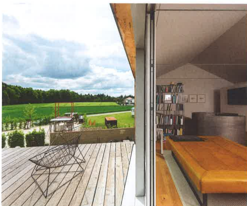
Links die Dachterrasse mit Ausblick, rechts das Satteldach mit Zugbändern aus Stahl: Der Bauherr wünschte sich einen Dachraum ohne Balken. Urs Weber lieferte eine unterspannte Dachelementkonstruktion ohne Firstabstützung, die nur durch die stählernen Zugseile zusammengehalten wird.